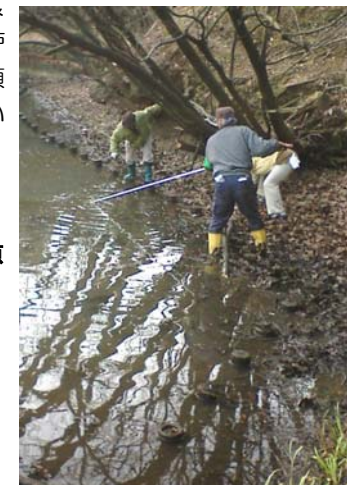
谷戸池公園清掃活動の一場面→