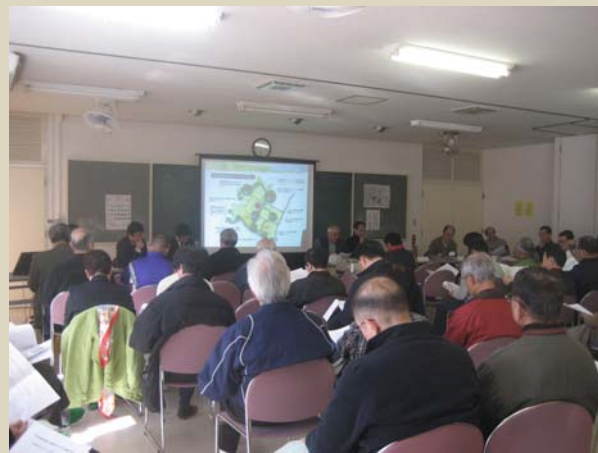
住民説明会当日の風景。67名の団地住民が会場を埋め尽くしました。