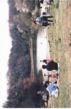
(港北ニュータウン鶴池公園)