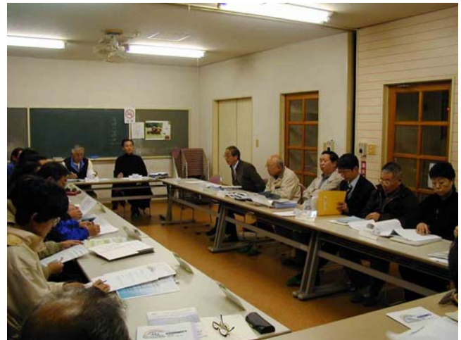
まちづくり協議会での協議・検討風景

なお、説明会の開催概要や説明会で住民のみなさんからいただいた質問・意見については、平成20年2月発行の9号まちづくり協議会ニュースに掲載しておりますので、併せてご覧ください。