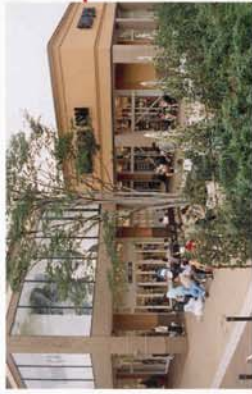
(南町田グランベリーモール)